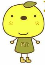
ゆずのまち美都キャラクター ゆずき