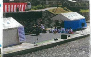
団員募集中。毎週水曜夜19:00~ ぶちあいホールの前にて