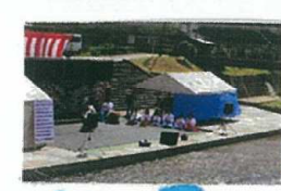
都茂こども神楽団

温泉を築き築きに掘ったドリルや、オープン当初の写真など貴重な資料を多数展示しました。(現在は終了してはか) 皆様から募集したメッセージカードは、現在無料休憩室に展示しています。